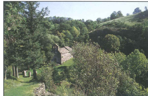
Chapelle de Jailhac

Cette promenade vous permettra de découvrir la commune de Moussages. Ce village d'altitude abrite dans son église classée une statue de bois du XI e siècle de “Notre-Dame-de-Clavier”, un des plus beaux bijoux de la sculpture du Moyen Age. Cette statue était placée à l'origine dans la petite chapelle de Jailhac. Surplombant la vallée du Mars, cette chapelle est le cadre privilégié d'un pèlerinage au mois d'août.