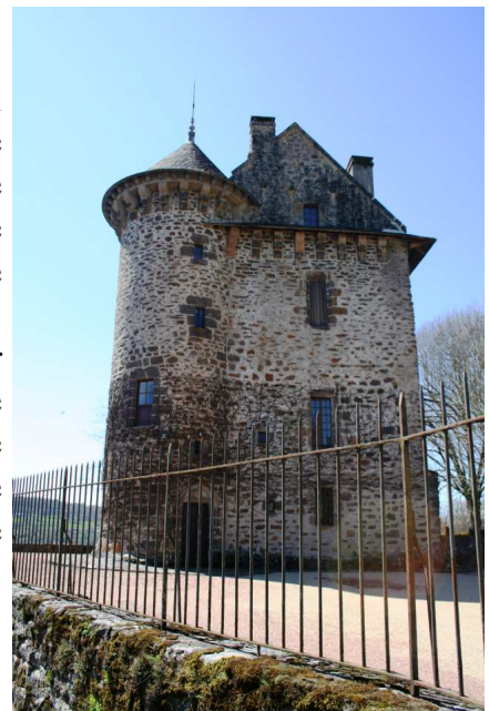
Le château de Chambres - XII e au XVIII e siècle

ATTENTION : ces châteaux ne se visitent pas.