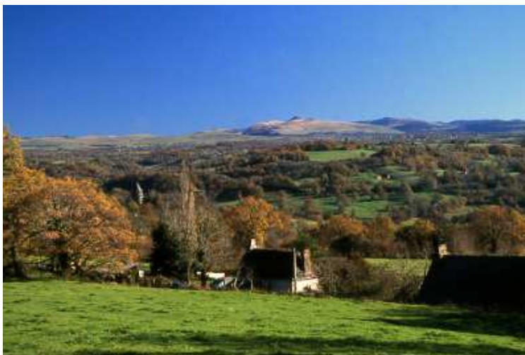
Chambres, sur le versant sud de la vallée de l'Auze