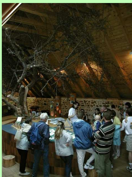
La Maison de la Forêt de Miers

2 Avant d'entrer dans Doumis, prendre le chemin qui part à gauche dans les prés. La pente s'accroît à l'entrée dans la forêt.