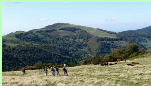
Dans les prés de Méallet