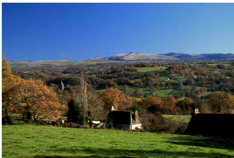
Le Puy Violent depuis la commune du Vigean : les plateaux du Nord Cantal offrent des paysages grandioses aux belles journées d'automne.

4 Poursuivre la route. Au croisement, prendre la route de gauche qui vous ramène à Conrut en passant par le hameau de la Blavadie.