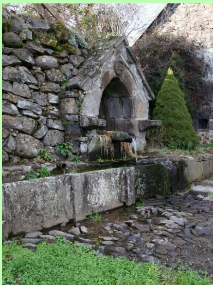
La fontaine de Conrut, datée de 1377

Mis à part peut-être l'aller-retour au rocher, la balade est très facile et convient aux marcheurs de tous âges.