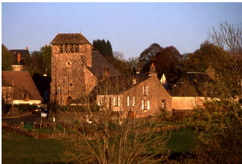
Le village du Vigean

Pour rejoindre le départ du sentier, il faut prendre la RD 678 à la sortie nord de Mauriac en direction de Trizac / Riom ès Montagnes. Environ 1 Km après le bourg du Vigean, prendre la petite route à gauche en direction de Conrut.