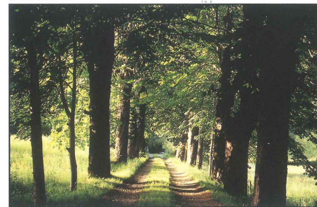
Chemin en sous bois

C'est au départ du charmant petit village de Sourniac situé sur un plateau volcanique que débute votre randonnée.